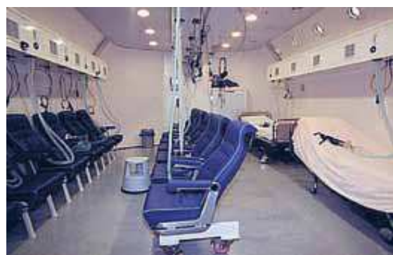
تصویر شماره (۱-۲) نمونه‌ای از اتاقک‌های درمان با اکسیژن هایپرباریک.