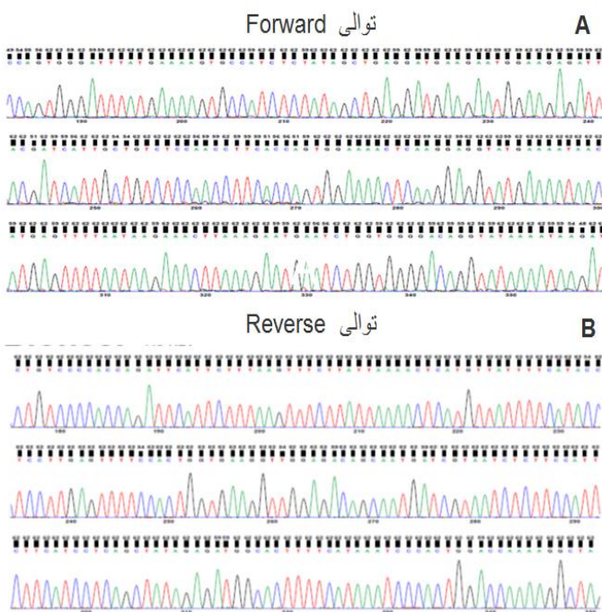
شکل شماره ۲. هالوگرام تعیین توالی شده قسمتی از ژن CYP3A4

در مطالعه حاضر در ۱۰ نمونه DNA حاصل از خون افراد دیابتی به همراه ۱۰ نمونه DNA حاصل از خون افراد سالم توسط تکنیک PCR جهت بررسی تنوع ژنتیکی