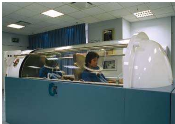
تصویر شماره ۱-۱) نمونه‌ای از اتاقک‌های درمان با اکسیژن هایپرباریک.

شرایط مورد نیاز قابلیت تبدیل شدن صندلی به تخت را نیز دارد (۱۶) (تصویر ۱-۱، ۲-۱، ۳-۱).