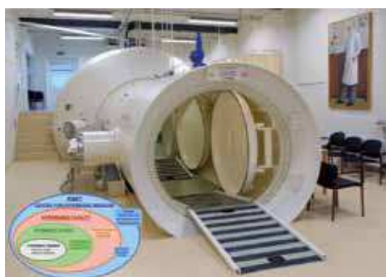
تصویر شماره ۱-۳) نمونه‌ای از اتاقک‌های درمان با اکسیژن هایپرباریک.

داده می‌شود مورد تأیید قرار داده است (۱۴). قدمت اکسیژن-درمانی به زمانی برمی‌گردد که برای اولین بار در اواخر قرن شانزدهم میلادی از هوای پرفشار برای درمان گرفتگی‌های قلبی استفاده شد. در همان دوران با پیشرفت‌های علمی جدید در زمینه فیزیولوژی پزشکی در اعماق دریا و سایر عملیاتی که در فشارهای زیاد انجام می‌شد، پزشکان برای جلوگیری از روی هم خوابیدن ریه‌ها در کارگرانی که در فشارهای زیاد کار می‌کردند دستور می‌دادند که از هوای تحت فشار زیاد استفاده شود. به علاوه در آن زمان‌ها از این روش در درمان غوآصانی نیز استفاده می‌گردید که دچار سندرم کمپرسیون ناشی از خروج ناگهانی از اعماق آب می‌شدند. در اواخر دهه ۱۹۷۰ هم دو پزشک هلندی به نام‌های بورما (Boerema) و برومل کمپ (Brummel Kap) از اکسیژن پرفشار برای عمل جراحی قلب باز استفاده کردند با این تصور که اکسیژن رسانی بیشتر مانع از ایست‌های عروق قلبی می‌شود آن‌ها پیش از کشف ماشین‌های بای پس عروق قلبی (Heart Lung bypass machines) عمل جراحی قلب باز را به صورت موفقیت آمیزی انجام دادند سپس این دو نفر از درمان بیماران دچار مسمومیت با گاز متواکسیدکربن و گاز گانگرن در اتاق اکسیژن هایپرباریک دوره جدیدی از درمان را آغاز کردند. اتاق اکسیژن هایپرباریک اولین بار از آن زمان به کار گرفته شد و شامل یک اتاقک از جنس آلومینیوم، استیل یا پلاستیک شفاف است که در داخل آن می‌توان هوا را چندین برابر فشار