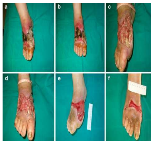
تصویر شماره (۲-۲) نمونه‌ای از زخم پای دیابتیک درمان شده با اکسیژن هایپرباریک.

از دیدگاه آنگر (Unger HD) اکسیژن رسانی کافی بافتی برای ارتقای التیام زخم و تحریک دفاع سلولی لازم است (۳۲). فلج (Flegg JA) و همکاران در سال ۲۰۱۰ در استرالیا در یک مدل ریاضی اکسیژن هایپرباریک را برای درمان زخم‌های مزمن دیابتی به کار بردند که درمان با اکسیژن هایپرباریک متناوب التیام زخم‌های مزمن را تسریع کرده اما جلسات درمانی بایستی که ادامه دار باشند تا زمانی که التیام کامل مشاهده شود (۳۳). در مطالعه‌ی زامبونی (Zamboni WA) درمان با اکسیژن هایپرباریک با پروتکل (اکسیژن ۱۰۰ درصد، ۱۲ اتمسفر abs، دو ساعت در روز، ۵ روز هفته) می‌تواند باعث کاهش معنی‌دار در اندازه‌ی زخم دیابتی شود (۳۴). لاندا در سال ۲۰۱۲ جلسات درمان با اکسیژن هایپرباریک را در مطالعه‌ی خود روزانه ۹۰ تا ۱۲۰ دقیقه جلسه بین ۲ و ۲/۵ اتمسفر مطلق برای ۳۰ تا ۴۰ جلسه‌ی درمانی می‌داند (۳۵). عفونت و هایپوکسی بافتی فاکتورهای مهم برای زخم پای دیابتیک غیر قابل التیام هستند (۵). اکسیژن هایپرباریک با وجودی که منافی برای درمان زخم‌های دیابتیک دارد باعث افزایش سطح اکسیژن بافتی، التیام زخم به وسیله‌ی مکانیسم‌های آنژیوژنز سنتز کلاژن، افزایش پاسخ فیبروبلاست‌ها و رگ‌سازی مجدد و افزایش فعالیت ضد باکتریایی لکوسیت‌ها شده باعث، یک سری عوارض جانبی نیز می‌گردد. درمان با اکسیژن پرفشار باعث مسمومیت با اکسیژن در مغز و ریه، باروتروماهایی در گوش میانی می‌شود (۵). شایع‌ترین عارضه جانبی باروترومای سینوس و گوش است که تقریباً ۵۲٪ در هر ۱۰۰۰۰ مورد رخ می‌دهد (۳۶). عارضه جانبی دیگر از اکسیژن هایپرباریک میوپیا است که چندین هفته بعد از درمان متوقف می‌شود (۳۷).